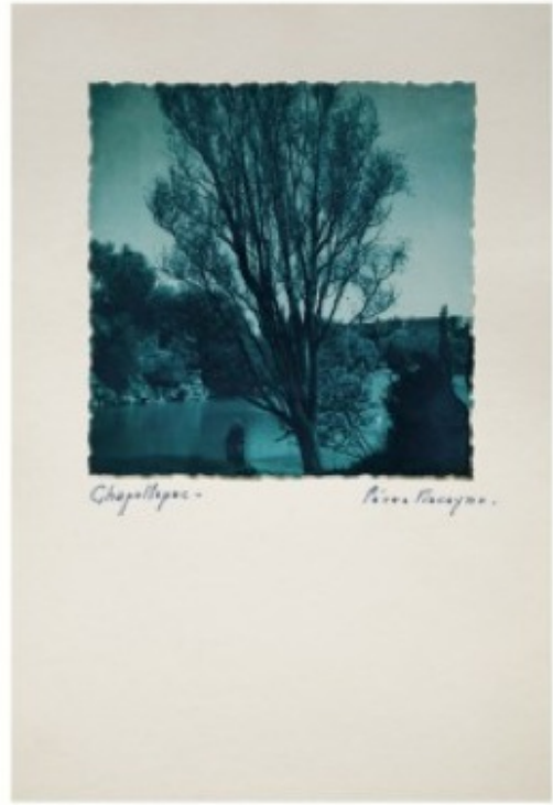
Chapallapuc - Paseo Pascopu.

"Apolca", ca. 1877-1898. Impresión de Agasa en azul sobre la cartulina.