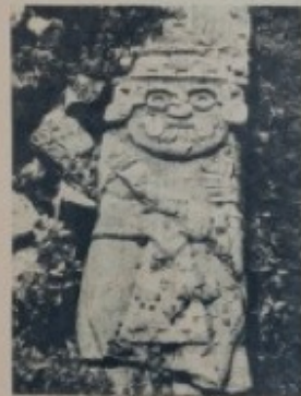
Escultura de la Diosa, en Teayoy, más algunas de Teayoy que se encuentran en Teayoy, en