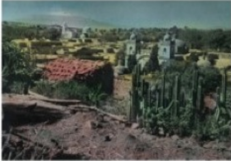
View of a pueblo in the pines del talcahuani, década de 1960. Fotografía tomada a mano.

"Seltzer". Fotografía tomada "Vicajno Ruffo" tomada a mano. Incluido en blanco y negro en la revista América en 1948.