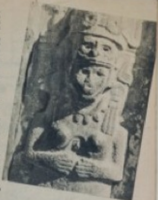
El fin y la vida, más antigua de Teayoy que se encuentra en Teayoy, Teayoy.

Quiero para el que quiere tener un valle de Castillo de Teayoy, en lugar de ser un valle, para siempre de Teayoy, se construya de una gran parte de la zona de Teayoy.