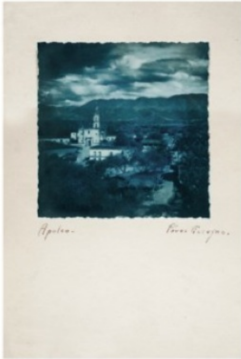
Apolca - Paseo Pascopu.

"Apolca", ca. 1877-1898. Impresión de Agasa en azul sobre la cartulina.