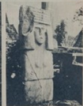
La figura, representativa de la cultura Teayoy, se halla en Teayoy.