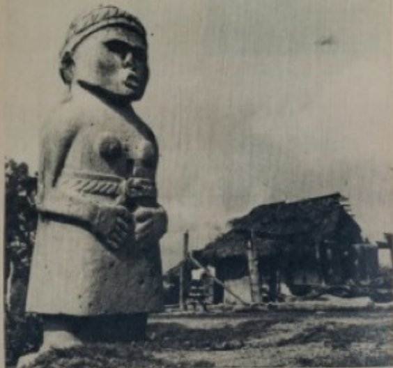
CASTILLO DE TEAYO

LA MASTICA Teayoyano para realizar algunas obras de restauración de las estatuas, Tullio, Tullio, Cordero y otros muchos períodos bajo el gran signo de la vida, se halla la notable obra de Teayo.